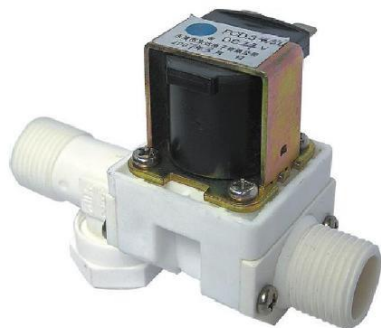
Рис. 1. Общий вид.

Широкое применение клапан может найти в системах «умный дом» (например в составе VM8039D), домашней автоматике, дачных бассейнах, системах автоматического полива, аквариумах и т.п.